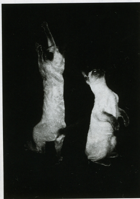
上がきになります＝小野田哲夫(静岡市) No.39456 EOS Kiss・EF20-35mm F3.5-4.5 USM・1/60・シャッター優先AE ストロボ・TX