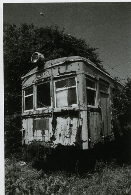
棄景＝井上修一(枚方市) No.105833 EOS 20D・EF-S17-85mm F4-5.6 IS USM・F8・絞り優先AE ISO200