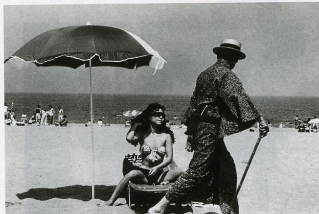
浜辺＝吉村儋代市(金沢市) No.40221 EOS620・EF35-105mm F4.5-5.6 USM・F8・1/125・コダック赤外