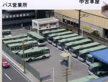
※ジオラマにバス営業所の建物を使用。