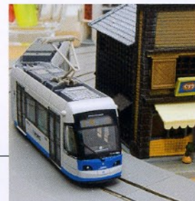
環境に優しい新時代の交通機関。