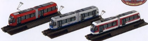
万葉線イトラム MLRV 1000型 岡山電気軌道 MOMO 9200型 熊本市交通局 0800型