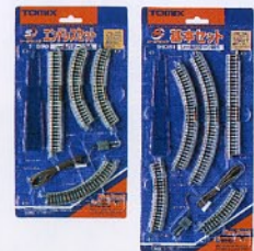
ミニレールセット各種 ¥1,995 (本体価格¥1,900) から