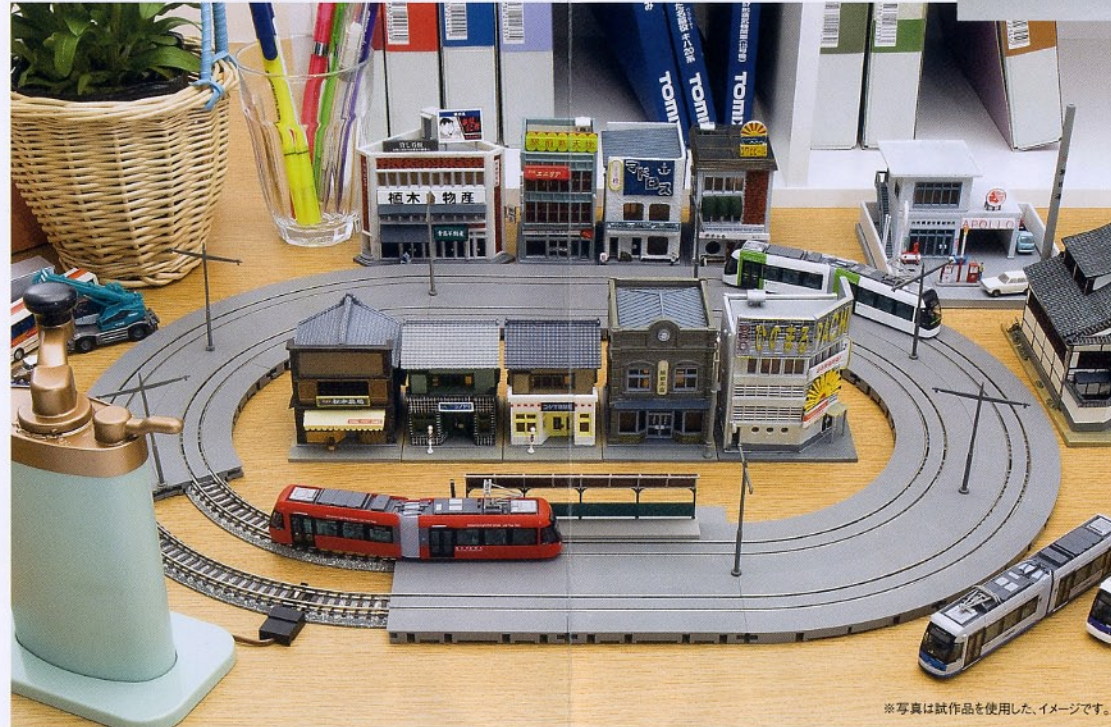
※写真は試作品を使用した、イメージです。