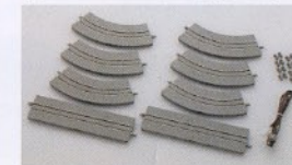
ワイドトラムレールセット各種 夏発売予定 ¥2,520 (本体価格¥2,400) から