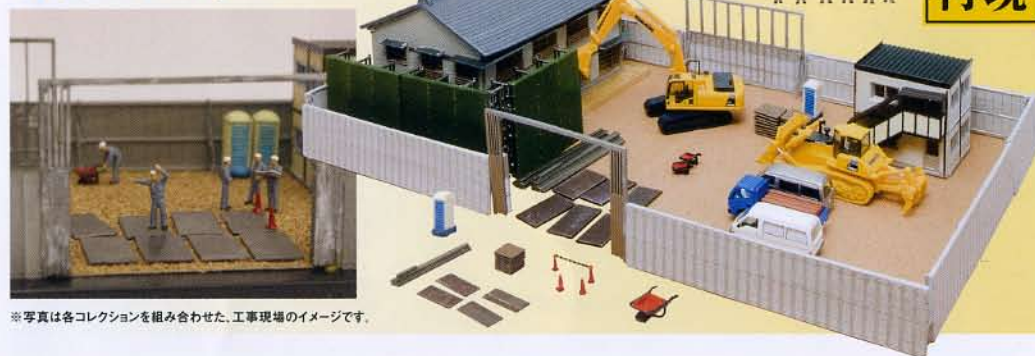
※写真は各コレクションを組み合わせた、工事現場のイメージです。