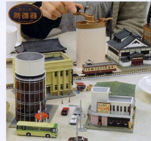
鉄コレ専用乾電池コントローラー ¥1,995 (本体価格¥1,900)

テーブルでも運転が楽しめる、コンパクトな電池式の鉄コレ専用コントローラー。 レトロで味のあるデザインが特徴です。