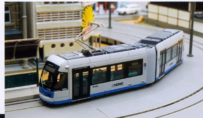
建物をすり抜けて電停に到着する“MOMO”。