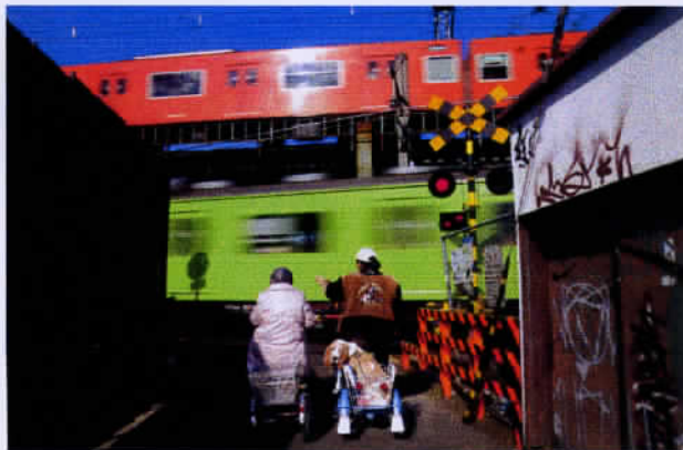
2席 踏切 野呂 彰 (大阪・120503)

D300 AF-S DX 16-85mm F3.5-5.6G ED VR 1/22 1/30sec. UV ISO200