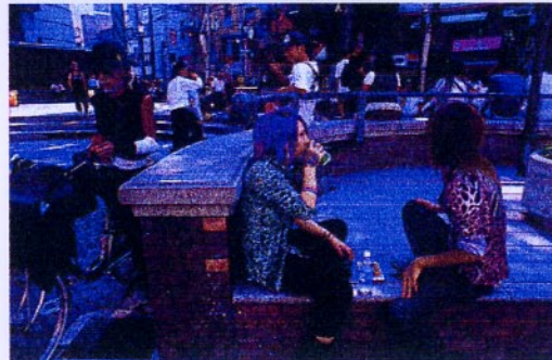
日本カメラ誌 2月号 銅賞 若者の街 伊藤広志

ニコンF100・24ミリ・エクタクロームE100V S 絞りF8・AE(88)フォトグループ 写画くらねこ 評 二人はよく似た服装なのでバンドマンなのかもいれません。街角をストリートに捉えています。が、たこ焼? を突きながらビールではなく、お茶やポカリというところに親しみが持てます。