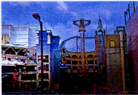
日本カメラ誌 2月号 銅賞 夢の跡 水荃 競

キャノンEOS50D・EF105mm F2.2マクロ・ISO5000・絞りF8.1・1000秒(1/3EV補正)・エプソン写真用紙・EpsonPX700G110(写画くらねこ) 遊園地の解体。個々が進化的なデザインなので、破壊の中にもファンタジーを感じる。やわらかい色味が童話画のようなイメージを作りだしている。