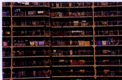
日本カメラ誌 2月号 銅賞 団地 岩田 進

ニコンF100・24mm F2.0マクロ・エリートクローム100 絞りF11 AE(写画くらねこ) 評 そのままスバリ団地を捉えています。が、何十世帯のベランダにはそれぞれの家庭の日常生活が写っています。洗濯物や布団の干し方にもそれぞれ流儀があるのが面白いですね。