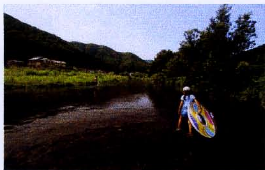
サロン・ド・ニッコール