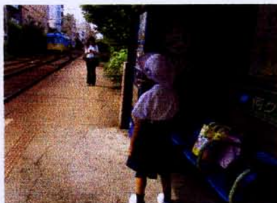
185 サロン・ド・ニッコール

川の中で少女が大きな浮輪を持ち、向こうでは男の子が網で何かつかまようとしている。川が奥まで続き低い山並みが見えて、静かな自然に包まれた夏の午後のゆったりした時間の流れを感じさせる。ズームレンズの広角側で撮って距離的な伸びやかさが表現されている。濃いグリーンの中に少女のブルーのシャツや浮き輪の色がくっきりと浮き上がって見える。