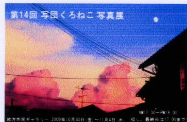
第14回 写団くろねこ 写真展

キャノンEOS 50D・EF 10~22ミリ・ISO 100・絞りF8・1/125秒・エプソンPX-G5100・エプソン写真用紙 (写団くろねこ) 評 早起きして撮影に出かけた甲斐があった。男たちが漁に出て、魚が水揚げされるのを待つ間に井戸端会議をする女性たちの普段の生活を、淡々と撮影しているところがいい。日常の中にも作品となるものがあるという好例だ。